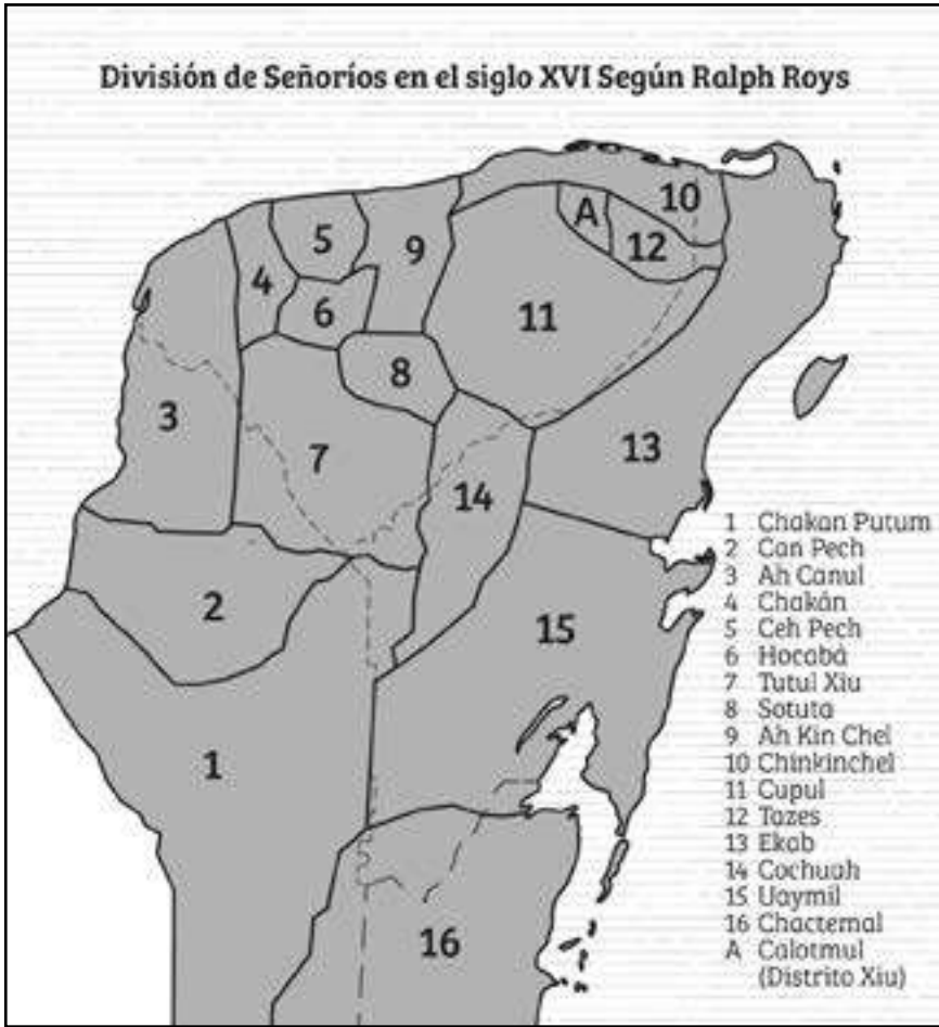
MAPA 1: LAS JURISDICCIONES MAYAS