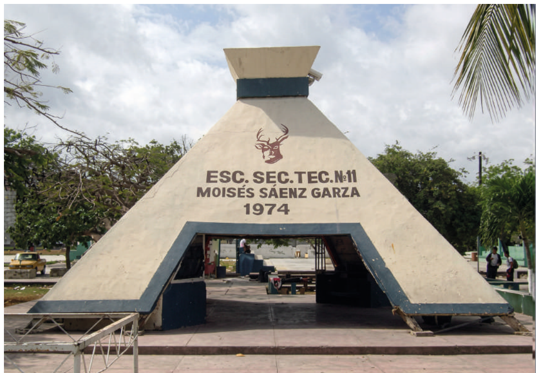
Una estructura piramidal ostenta el símbolo de la escuela, vinculado a la fauna de la selva