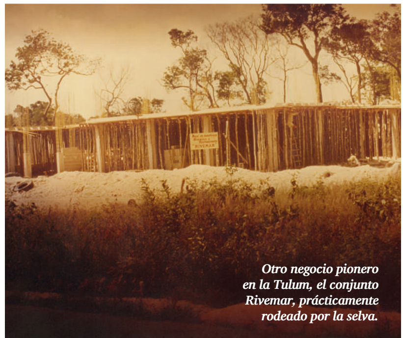
Otro negocio pionero en la Tulum, el conjunto Rivemar, prácticamente rodeado por la selva.

dió ese atractivo, lo mismo que Chetumal. La Tulum también fue una zona de restaurantes. No recuerdo los nombres porque los cambiaron de continuo, muchos propietarios cambiaban el nombre pero seguían vendiendo igual, porque eran lugares de consumo. Recuerdo el restaurante Águila, junto a la tienda, creo que uno era D'Leo , junto a Palacio Municipal estaba la Pop , que era el centro de reunión de los políticos. Todo eso es parte de la historia.