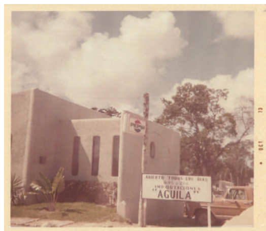
Importaciones El Águila, el primer comercio que abrió en la avenida Tulum