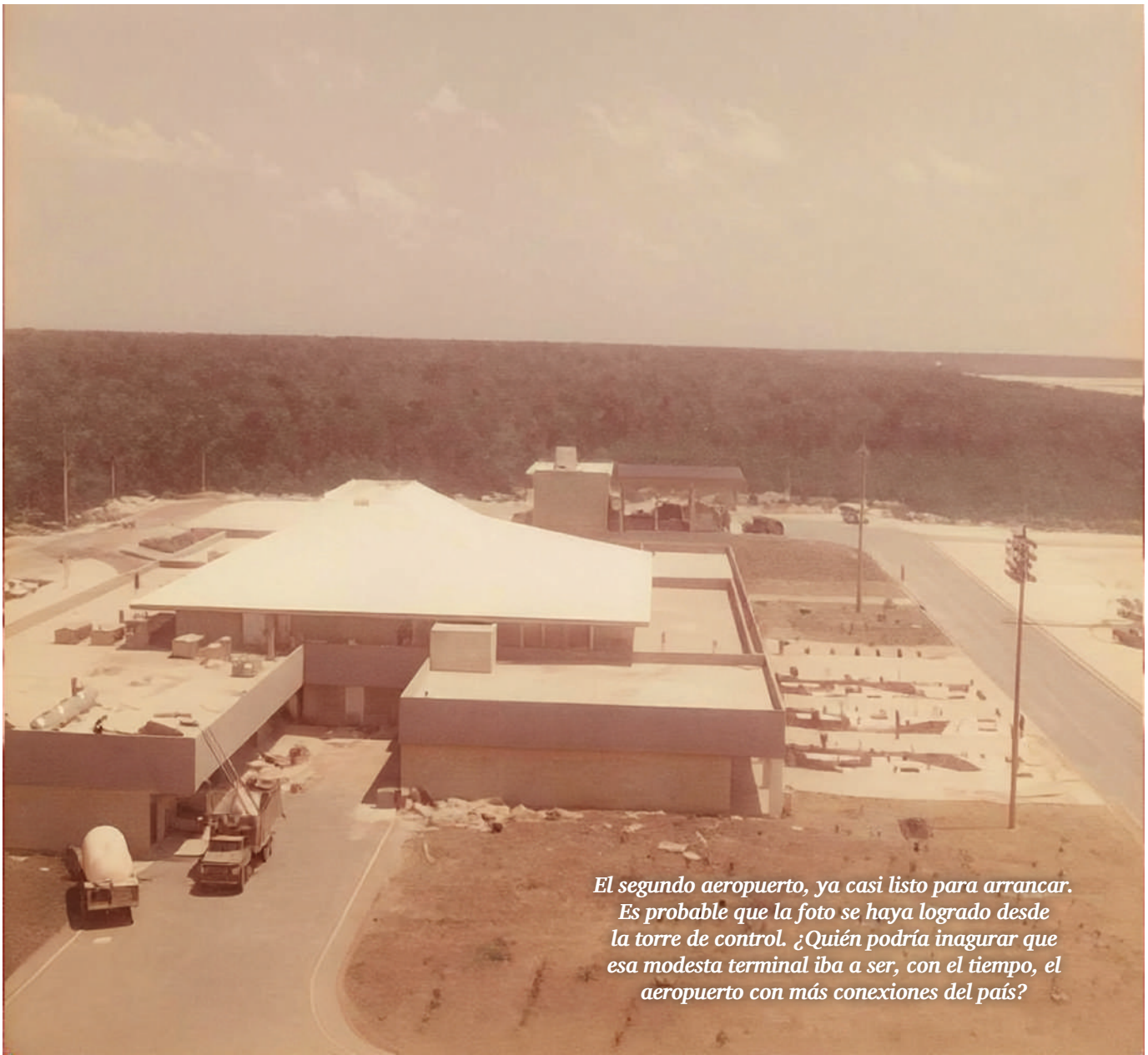
El segundo aeropuerto, ya casi listo para arrancar. Es probable que la foto se haya logrado desde la torre de control. ¿Quién podría inaugurar que esa modesta terminal iba a ser, con el tiempo, el aeropuerto con más conexiones del país?

José Luis Mitzunaga: Con algunas semanas de retraso, pero en un tiempo muy aceptable, por la complejidad de la obra, la lejanía de los proveedores, la dificultad para con-