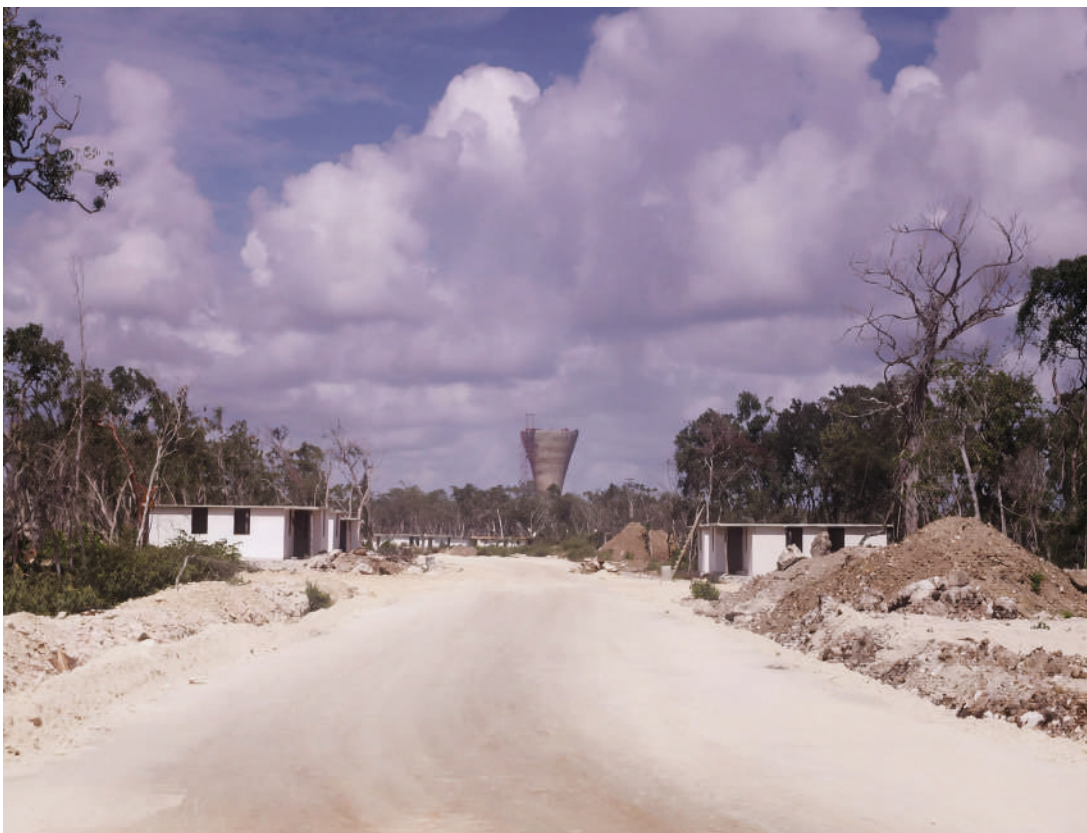
Otra avenida pionera, la Uxmal, con la silueta característica del tanque de agua, que aún se destaca en el horizonte.