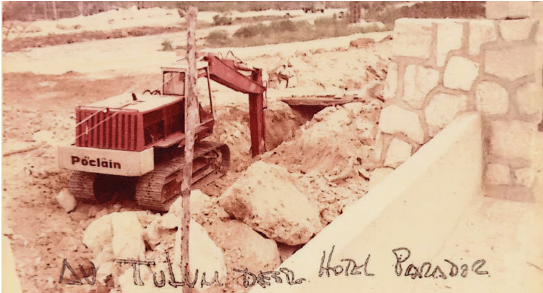
Esta gráfica, captada desde la obra negra del hotel Parador, muestra con claridad que avenida Tulum seguía siendo una vía sin pavimentar a fines de 1973.