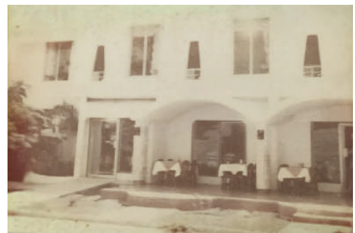
Las ventanas que imitan el arco maya son un rasgo de este hotel pionero, Carrillo's, cuyo nombre se estrenó con el restaurante que daba a la calle.