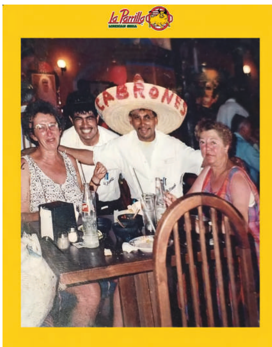
El trompo de los tacos al pastor formaba parte de la decoración exterior en los primeros años de La Parrilla.

disco, todo el mundo se iba a la Yaxchilán, y ahí terminábamos hasta las ocho, nueve de la mañana, ahí se acababa la fiesta. Y como dice Miguel Ángel, sí era muy difícil, porque de ahí, después de cerrar el negocio, era irse al mercado 23. Ahí comprába-