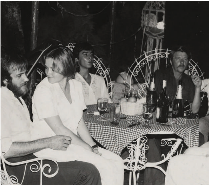
El famoso y acogedor jardín maya, refugio de los windsurfistas.