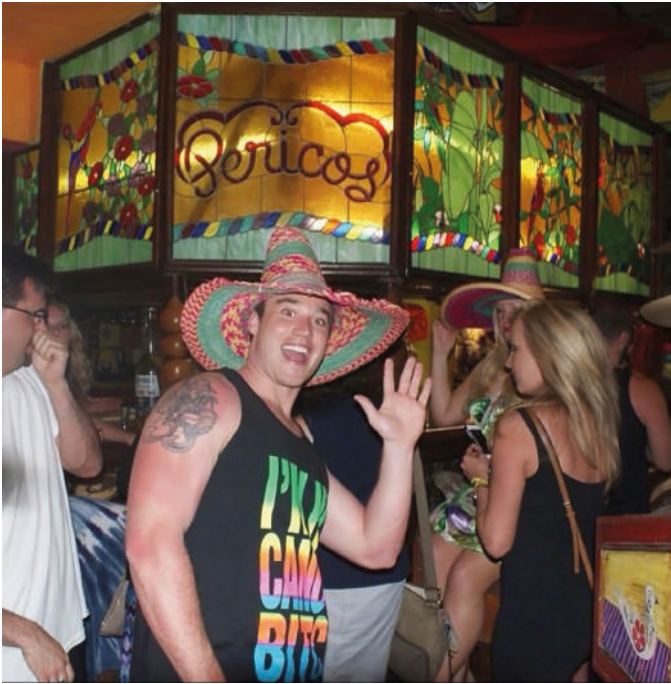
La fiesta mexicana en su versión parranda sin frenos.