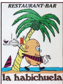
Un cartel publicitario con un sabor casi infantil.