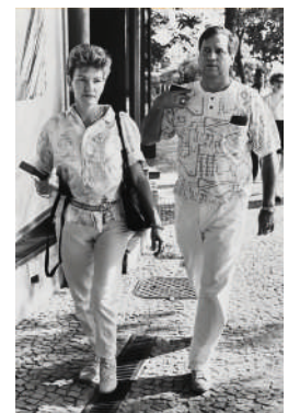
Tere y Chockos arribando a Chocko,s & Tere.

“ Cuando llegó a clausurarme el señor Bigurra, se encontró que ahí estaba comiendo la mitad del gabinete presidencial.”