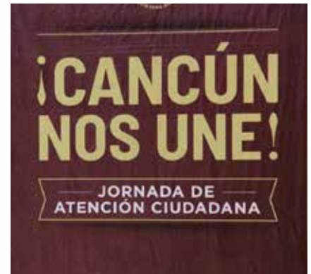
La réplica de los municipios.