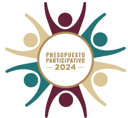
El experimento de participación de los vecinos.

Mas allá de estas iniciativas, que por su naturaleza tienen un carácter inmediato y coyuntural, el actual gobierno está centrando