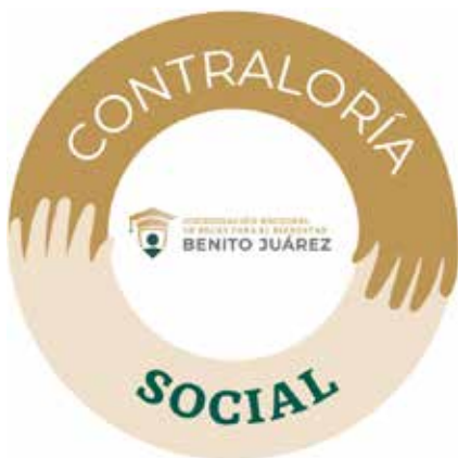
Las iniciativas de la contraloría.

Opina Athié: “Si haces una encuesta abierta, nadie te va a pedir que hagas una central de carga en el aeropuerto, o que amplíes el fundo legal de una ciudad, o que construyas un puerto de altura en el litoral para potenciar la utilidad del Tren Maya. Ni siquiera te van a pedir que construyas el Tren Maya. Hay proyectos de gobierno que tienen un componente estratégico, que requieren una visión de conjunto que no se percibe desde la base.”