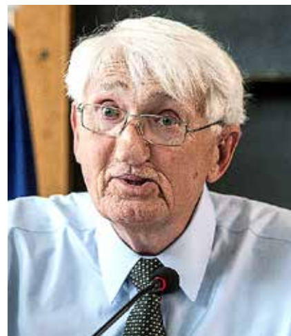
Habermas: “La ética del discurso y la teoría de la democracia deliberativa.”