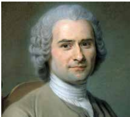
Rousseau: “El gobierno anula el sentimiento de libertad.”